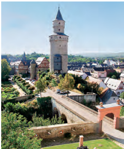
Hexenturm (1170), ältestes Bauwerk und Wahrzeichen der Stadt