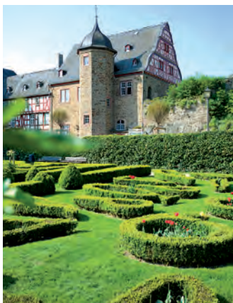
Altes Amtsgericht (1588)