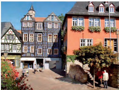
König-Adolf-Platz mit Rathaus (1698) und Schiefem Haus (1728)