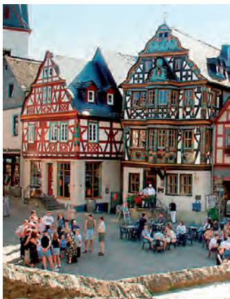
Killingerhaus (1615), prachtvoller Fachwerkbau, heute Tourist-Info und Stadtmuseum